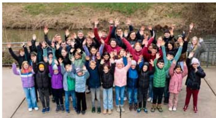
Teilnehmer und Betreuer beim Jugend-Probewochenende der Staka

Am 14. und 15. Februar fand unser diesjähriges Jugend-Probewochenende in Zusammenarbeit mit der Jugendmusikschule der Stadt Öhringen statt. Ziel war die intensive Vorbereitung auf das Jugendkonzert.