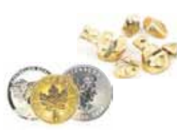
Zahngold / Goldmünzen