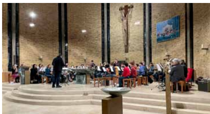
Musikerinnen der Staka bei den ersten Proben in der katholischen Kirche

Ein musikalisches Zusammentreffen der besonderen Art findet am 9. Mai um 19 Uhr in der katholischen Kirche St. Joseph in Öhringen statt. Eines der imposantesten Instrumente, die es gibt, die Kirchenorgel, wird mit den Klängen eines symphonischen Blasorchesters vereint. Die Stadtkapelle Öhringen und Patrick Gläser, über die Landesgrenzen hinaus bekannt durch sein Projekt „Orgel rockt“, bieten an diesem Abend musikalische Höhepunkte, die unter die Haut gehen. „Orgel rockt“ ist ein Projekt für Orgel solo, bei dem Coverversionen aus Rock, Pop und Filmmusik auf der Kirchenorgel gespielt werden. Beim gemeinsamen Konzert in der katholischen Kirche wird dies mit dem großen Blasorchester der Stadtkapelle kombiniert. Freuen Sie sich auf Gänsehautmomente. Sie erleben ein Konzert, bei dem sich die beteiligten Musikerinnen und Musiker für das 225-jährige Jubiläum der Stadtkapelle einen Traum erfüllen: Gemeinsam mit einer Kirchenorgel ein Highlight für alle Musikfans zu schaffen. Der Eintritt ist frei, Spenden sind herzlich willkommen.