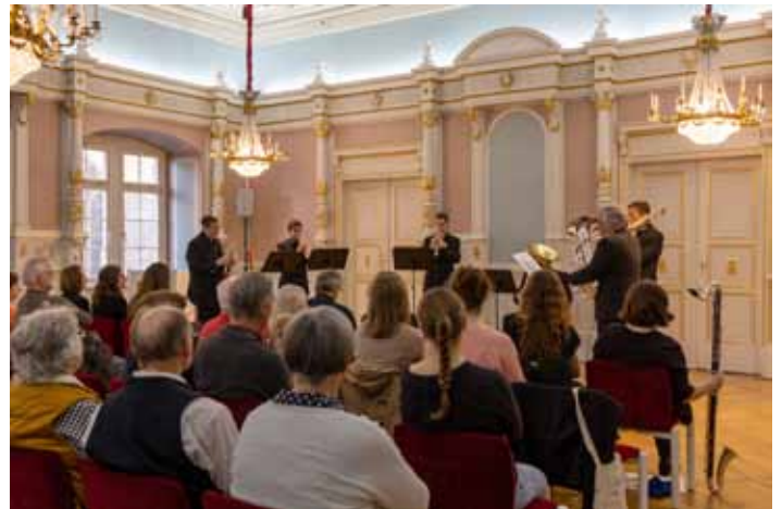
Blechbläserensemble beim Kammerkonzert im Jahr 2024

Zum diesjährigen Kammerkonzert am 16.03.2025 um 17 Uhr lädt die Stadtkapelle Öhringen herzlich in den Blauen Saal ein. Das Kammerkonzert stellt eine traditionelle Veranstaltung im Jahresablauf der Stadtkapelle Öhringen dar und darf daher auch im Jubiläumsjahr nicht fehlen. Auch in diesem Jahr haben sich wieder verschiedene Ensembles für das Konzert zusammengefunden, um einen musikalisch abwechslungsreichen Abend im Öhringer Schloss zu gestalten. Die musikalische Vielfalt des Programms reicht von klassischen Werken bis hin zu modernen Stücken. Die Ensembles bestehen teilweise schon seit vielen Jahren. Der Eintritt ist frei. Anlässlich des 225-jährigen Jubiläums