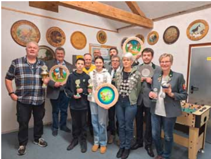
Preisträger vom Dreikönigsschießen 2025

Erstmals hat die Schützengilde Öhringen zwei Schützenköniginnen