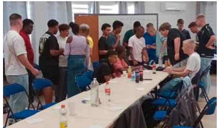
Die Azubis aus Hohenlohe mit ihren Gastgebern auf La Réunion im Herbst 2024 beim Sprachkurs

Im Gepäck hat er seine neuesten Geschichten und auch sein zuletzt erschienenes Buch über die verbindende Kraft des Essens und die Schokoladenseiten unserer Nachbarn. Und auf die ist kaum jemand so neugierig wie Wladimir Kaminer. Egal ob es um einzelne Menschen oder ganze Länder geht. Ist man zu Gast an fremden Tischen, verliebt man sich nicht nur die Kultur der anderen ein, man erfährt auch deren Träume, Wünsche, Sorgen und Hoffnungen. Auf seinen Reisen durch Europa nascht Wladimir Kaminer von den Tellern Portugals ebenso wie aus den Honigtöpfchen Bulgariens, er trinkt den Wein der Republik Moldau und tunkt den Löffel in die Töpfe Serbiens. Vor allem aber kommt er mit den Menschen ins Gespräch und taucht tief in deren Geschichte und Geschichten ein. Seine Streifzüge zeigen ein Europa, das so vielfältig, bunt und überraschend ist wie seine Speisen. Eintritt: kostet 20 €, Karten gibt es im Vorverkauf in der Stadtbücherei und in der Buchhandlung Rau In Kooperation mit vhs, dem Sachgebiet Jugend und Integration der Stadt Öhringen und der Hohenlohe'schen Buchhandlung Rau.