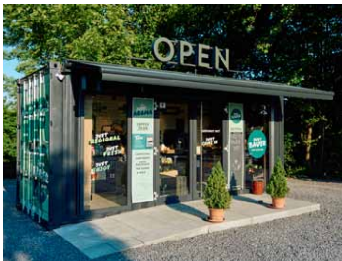
Der erste Food-Stop von Just Bauer am Limesring in Öhringen

Es gab vieles, das im Laufe der Entwicklung immer wieder verändert wurde – eines aber musste sein: Das große, leuchtende OPEN-Schild auf dem Dach. In den letzten beiden Jahren ist der Food-Stop für viele zu dem perfekten Ort für den kleinen – und manchmal auch – großen Einkauf geworden. Die schriftliche Resonanz im kleinen