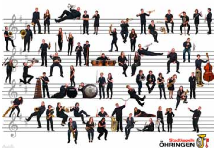
Musikerinnen und Musiker der Stadtkapelle

nem lebendigen Vereinsleben und einer intensiven Jugendarbeit sowie einem erfolgreichen Stammorchester entwickelt. Davon zeugen nicht nur die hervorragenden Teilnahmen an Wertungsspielen am Deutschen Musikfest, sondern auch die verschiedenen musikalisch hochwertigen Konzerte der Stadtkapelle. Davon können Sie sich im Jahresverlauf überzeugen, denn die Stadtkapelle hat die unterschiedlichsten Konzerte geplant, um mit Ihnen gemeinsam das Jubiläumsjahr zu feiern: 16.03.2025 Kammerkonzert; 04.04.2025 Jugendkonzert; 01.05.2025 Schlosshofkonzert; 09.05.2025 Stadtkapelle feat. Orgel