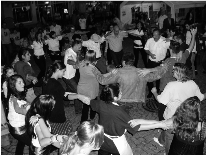
Gemeinsam feiern und tanzen kann man bei der interkulturellen Woche in Öhringen.

liegt, oder auf der Homepage www.ikw-oehringen.de Kabarett, Lesungen, Filme und Großes Kinderfest mit „Checker Tobi“