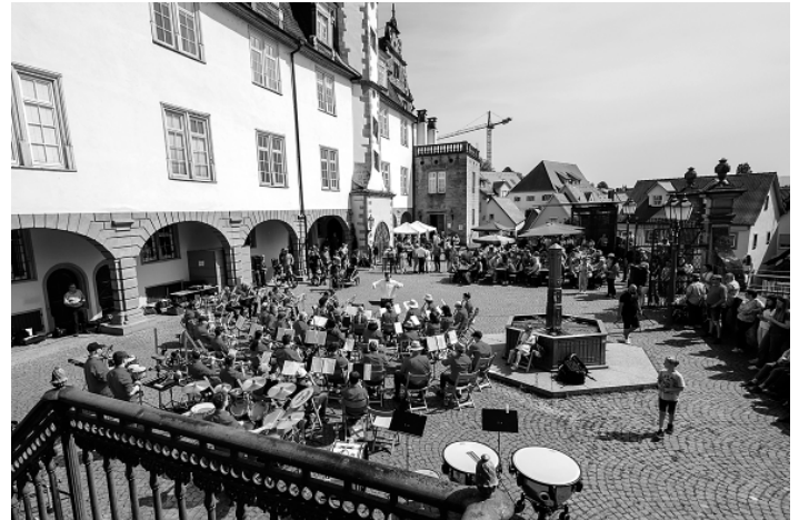
Stadtkapelle im Schlosshof Öhringen

Im Anschluss an das „Brauchtum unter dem Zunftbaum“ eröffnete die Stadtkapelle auch in diesem Jahr die musikalische Hofgartensaison. Gegen 10.45 Uhr strömte die Stadtkapelle gefolgt von einer Vielzahl an Zuhörerinnen und Zuhörer in den sich merklich füllenden Schlosshof. Den Anfang machte die Jugendkapelle. Danach übernahm die Stadtkapelle mit einem vielfältigen Programm. Beide Kapellen spielten ihr Konzert unter der Leitung von Timo Heller. Für das leibliche Wohl war dabei mit verschiedenen Leckereien an den Getränke- und Essenständen der Staka gesorgt.