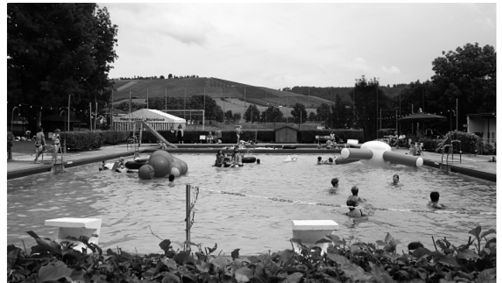
Das „Bädle“ in Michelbach wird vollumfänglich saniert und bekommt neue Edelstahlbecken.