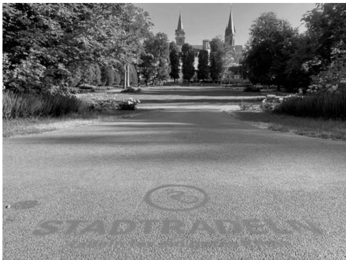
Öhringen STADTRADELN zum vierten Mal für mehr Klimaschutz.