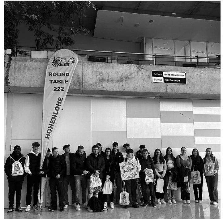
Schülerinnen und Schüler der Kaufmännischen Schule Öhringen (KSÖE) mit den alten bzw. neuen Rechnern.

Wohin mit dem alten Rechner, der noch lange nicht Schrott ist, aber nicht mehr gebraucht wird? Auf keinen Fall in den Müll. Nachhaltigkeit und verantwortungsvoller Umgang mit wertvollen Ressourcen geht anders. So wie an der Kaufmännischen Schule Öhringen. Hier wurden 32 Laptops im Rahmen der Aktion „HEY, ALTER! Alte Rechner für junge Leute“ wieder fit gemacht, neu auf-